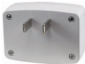
Рис. 1 – Вид сзади

Установите прибор в розетку однофазной электрической сети. При необходимости используйте переходник для вилки. После установки прибор сразу перейдет в режим измерения напряжения.