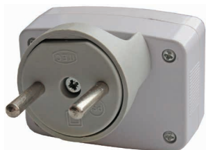
Рис. 1 – Вид сзади с надетым переходником для евророзетки